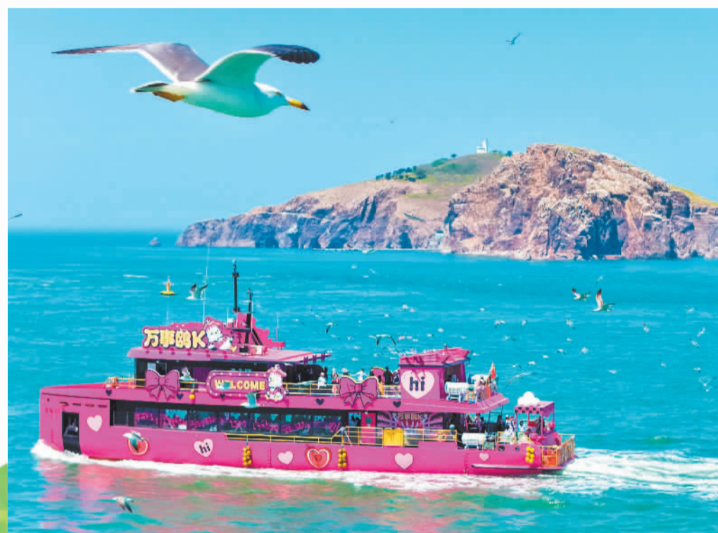
▲4月30日,游客乘坐“万事OK”号游船在山东省荣成市海驴岛海域游览、观光。 ▼4月25日,广西壮族自治区桂林市阳朔县遇龙河风光旖旎,游客乘坐竹筏游玩。