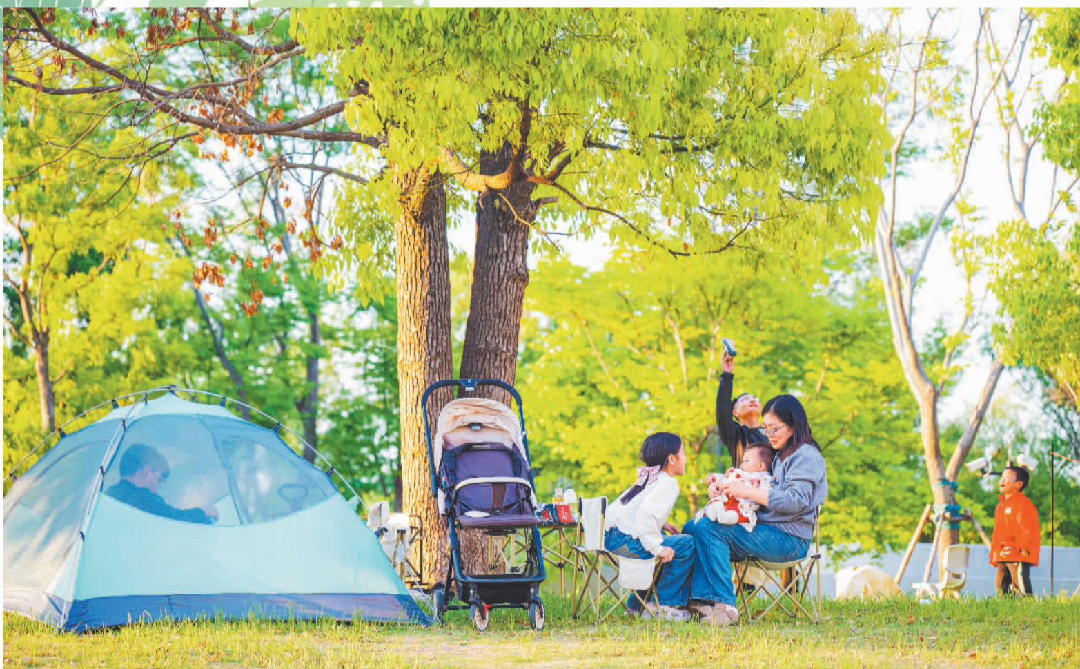
▲5月3日,市民游客在江苏省宿迁市宿城区河滨街道一生态公园露营休闲。 ▼5月4日,四川省眉山市丹棱县张场镇老峨山风景区,小朋友在体验户外运动项目。