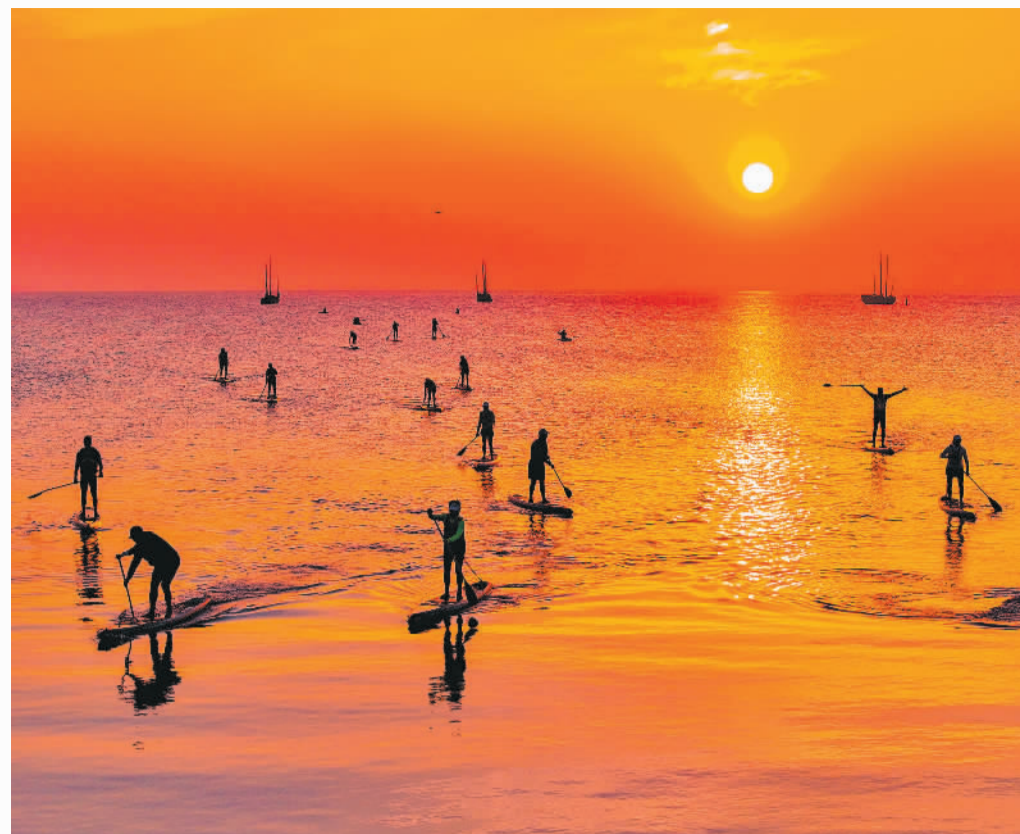
▲5月1日,浙江省湖州市长兴县,桨板爱好者迎着朝霞在太湖上踏浪前行。 ◀5月2日,湖南省湘潭县石鼓镇铜梁村曹家坳瀑布,游客在爬山赏景。