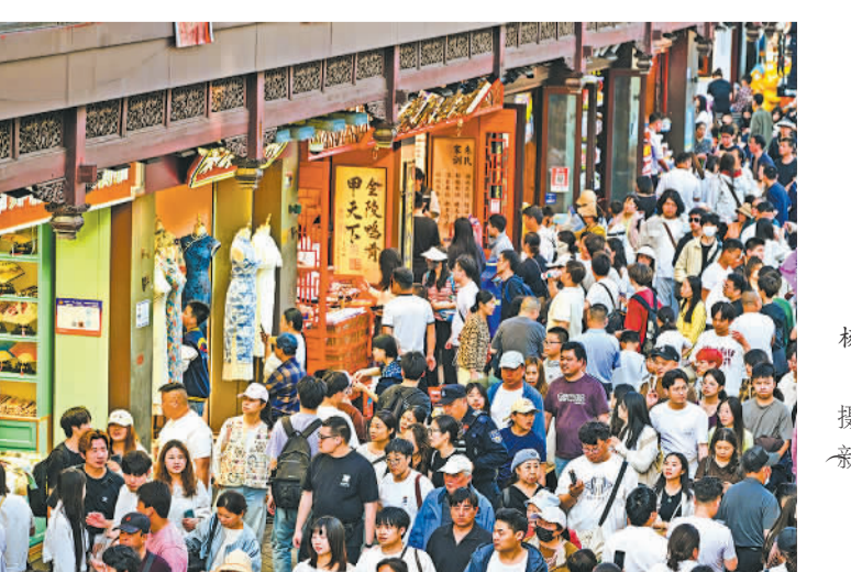
五月游南京,市民在夫子庙景区游玩。(资料图片)

国家特聘专家、东南大学首席教授张峻屹说,南京和马鞍山两地在新材料、钢铁制造、装备制造等方面具备