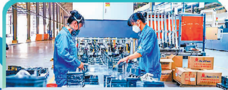
工人在广东凯捷电源有限公司生产车间作业。(资料图片)

“爱情真挚比排场重要,家风淳朴比彩礼珍贵。”长沙县委常委宣传部分管日常工作的副部长何典表示,下一步,长沙县将持续强化宣传引导、健全约束机制、丰富活动载体,打造更多简约浪漫、有内涵、有温度的新式婚礼场景,让“少些排场、多些幸福”成为风尚。