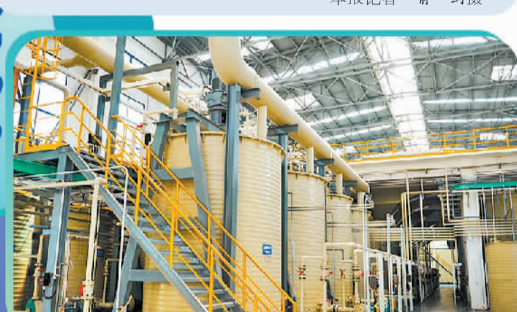
四川蜀矿环锂科技有限公司废旧电池粉料湿法冶炼溶解除杂车间。(资料图片)