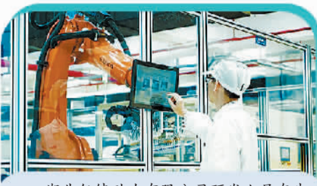
湖北亿纬动力有限公司研发人员在生产车间调试设备。(资料图片)

近日,由工业和信息化部等6部门联合发布的《新能源汽车废旧动力电池回收和综合利用管理暂行办法》(以下简称《暂行办法》)实施,对动力电池实行全生命周期监管。伴随我国新能源汽车产业规模化发展,动力电池“退役潮”加速来袭,废旧动力电池回收利用产业已从“政策驱动”向“市场与规范双轮驱动”转变。