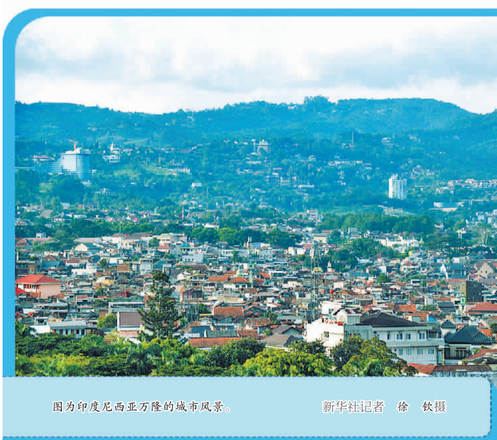
图为印度尼西亚万隆的城市风景。