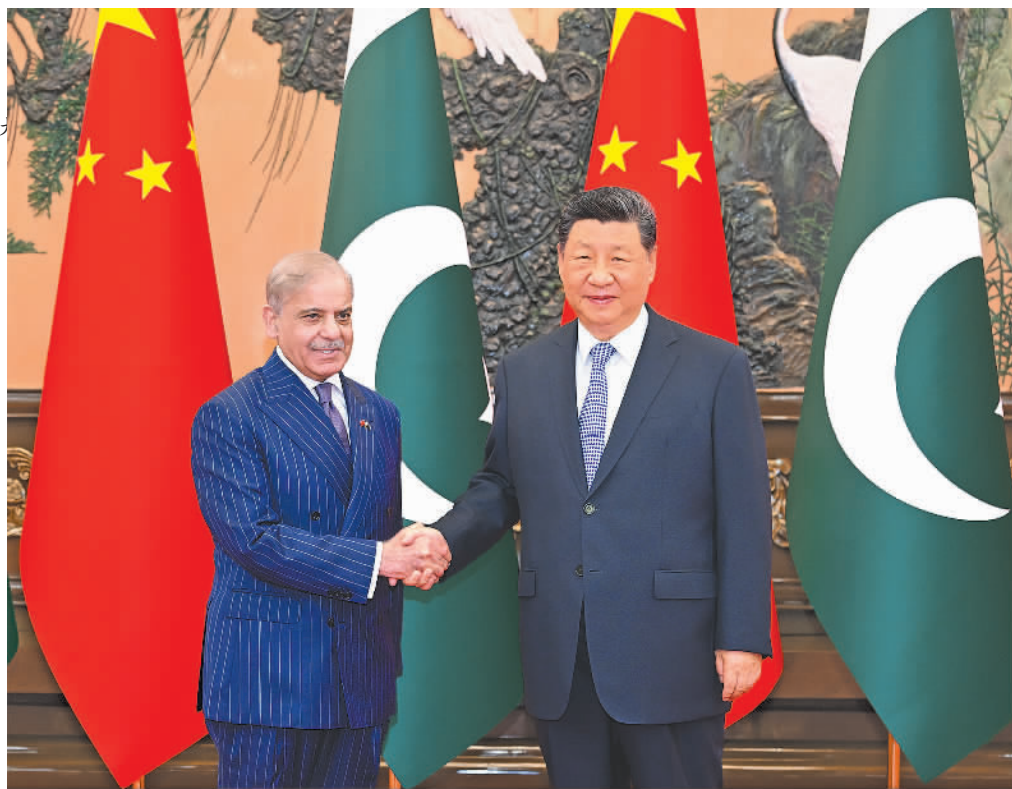
两国人民,为促进地区和平稳定作贡献,为构建周边命运共同体作示范。

习近平强调,中方坚定支持巴方维护独立、主权和领土完整,愿同巴方保持高层交往,加强战略沟通,把握两国关系正确发展方向。双方要扎实推进构建中巴命运共同体行动计划,统筹推进重大标志性工程和“小而美”民生项目建设,深化农业、产业、人工智能、人才培养等全方位合作。双方要开展更高水平、更广领域安全合作,共同维护地区和平稳定。中方赞赏巴方主动担当,为恢复中东地区和平发挥斡旋作用。双方要继续保持密切沟通和协调,共同反对单边主义和冷战思维,共同推进平等有序的世界多极化和普惠包容的经济全球化。 夏巴兹表示,习近平主席是巴基斯坦人民伟大的朋友,也是世界上所有爱好和平人民的伟大朋友。在习近平主席坚强领导下,中国经济取得举世瞩目成就,为维护世界和平、构建多极世界提供了坚实保障。巴中钢铁友谊由两国老一辈领导人亲手缔造,历久弥坚,无可比拟。巴方坚定奉行一个中国原则,在所有涉及中国核心利益的问题上坚定支持中方立场,永远做中国的好朋友、好伙伴。巴方愿同中方共同庆祝建交75周年,学习中国治国理政经验,深化“一带一路”合作,推进中巴经济走廊建设,让巴中关系不断向前发展,造福两国人民。感谢中方支持巴方斡旋美伊谈判。习近平主席就中东局势提出的四点主张是实现和平的指导性方案。巴方愿同中方密切协调,共同为促进世界和平稳定作出贡献。 王毅参加会见。