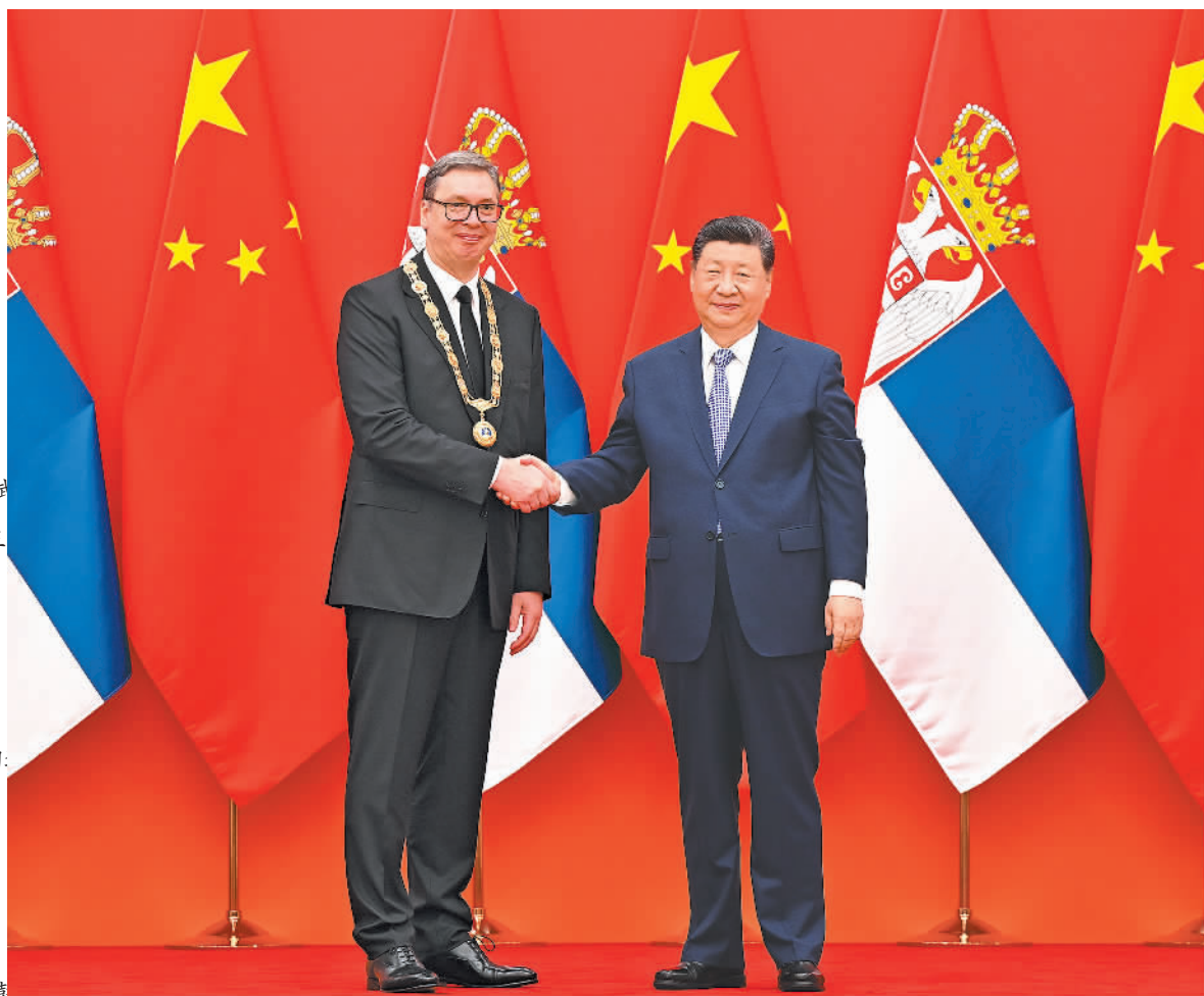
颁奖仪式在人民大会堂举行。

新华社北京5月25日电(记者杨依军)5月25日晚,国家主席习近平在北京人民大会堂为塞尔维亚总统武契奇举行“友谊勋章”颁授仪式。 中塞两国国旗整齐排列,背景板上金色的“友谊勋章”图案熠熠生辉。中国人民解放军仪仗队礼兵在授勋台两侧肃立。 仪式开始,雄壮的礼乐声响起,金色大门徐徐打开,习近平主席和武契奇总统一同步入大厅。习近平主席夫人彭丽媛、武契奇总统夫人塔玛拉随行。礼乐声中,习近平主席和武契奇总统在授勋台上握手。习近平主席将“友谊勋章”别在武契奇总统胸前。武契奇总统在授勋台上发表讲话,感谢中方对塞尔维亚的友好支持,表示塞中两国关系在习近平主席和武契奇总统的引领下,达到了前所未有的高度,两国人民友好情谊日益深厚。习近平主席在讲话中高度评价了武契奇总统为塞中友好所作贡献,表示中方愿同塞方一道,深化两国全面战略伙伴关系,推动两国关系取得更多实实在在的成果。 习近平主席在讲话中强调,“友谊勋章”是中华人民共和国对外最高荣誉勋章,这枚勋章不仅是对武契奇总统为中塞友好所作贡献的高度肯定,也寄托着两国人民对新时代中塞命运共同体建设的殷切期望。中塞友谊经历过血与火的淬炼,在当前国际风云激荡中更显弥足珍贵。中塞人民坚定追求独立自主,坚定捍卫民族尊严,坚定维护国际公平正义,必将在各自发展振兴征途上不断取得新的胜利。 随后,党和国家功勋荣誉表彰工作委员会副主任、外交部长王毅宣读《中华人民共和国主席授勋令》。礼兵护送“友谊勋章”入场。 习近平发表致辞。 习近平指出,武契奇总统长期致力于中塞友好,大力推动两国关系发展,是中塞全面战略伙伴关系的积极建设者和坚定维护者。在涉及中国核心利益和重大关切问题上,武契奇总统始终给予中方最坚定最明确的支持,赢得广大中国人民的尊重。当前,中塞两国政治互信坚如磐石,务实合作成果瞩目,世代友好深入人心,共同打造了一个又一个友好合作的经典项目。事实证明,中塞两国相互支持、共谋发展,合作共赢,彼此成就,实实在在造福两国人民,树立了国与国交往的典范,为国际社会提供了值得借鉴的样板。 习近平强调,“友谊勋章”是中华人民共和国对外最高荣誉勋章,这枚勋章不仅是对武契奇总统为中塞友好所作贡献的高度肯定,也寄托着两国人民对新时代中塞命运共同体建设的殷切期望。中塞友谊经历过血与火的淬炼,在当前国际风云激荡中更显弥足珍贵。中塞人民坚定追求独立自主,坚定捍卫民族尊严,坚定维护国际公平正义,必将在各自发展振兴征途上不断取得新的胜利。 随后,党和国家功勋荣誉表彰工作委员会副主任、外交部长王毅宣读《中华人民共和国主席授勋令》。礼兵护送“友谊勋章”入场。 (下转第二版)