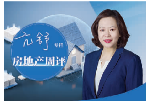
□ 本报记者 赖奇春

设发展离不开外来务工人员、新就业青年、公共服务人员等稳定就业居住的未落户常住人口，他们为城市运转贡献力量，是产业发展的支撑。安居才能乐业，当劳动者不再为居住问题发愁，才能更专注于本职工作，更愿意为城市建设贡献力量。只有他们的安居需求得到满足，才能激发起更大的消费潜力，让城市更具韧性与活力。