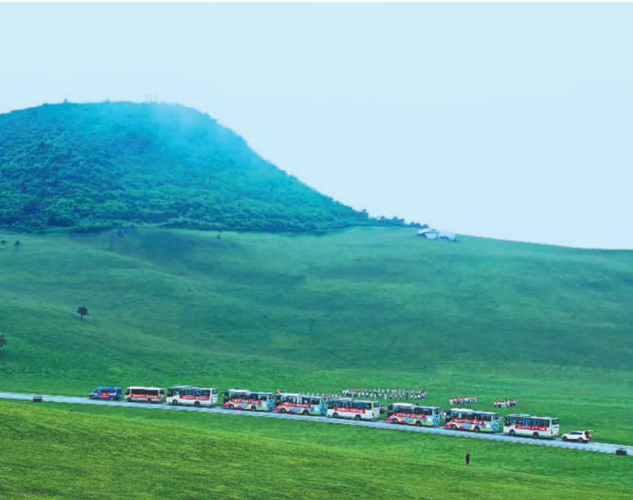
近日，研学团队在重庆市酉阳土家族苗族自治县蒲草草原开展活动。近年来，该县依托蒲草草原独特的高山气候，大力发展高山纳凉、航空飞行、自驾露营、研学拓展、温泉康养、冬季冰雪和体育赛事等，促进文旅产业快速发展。