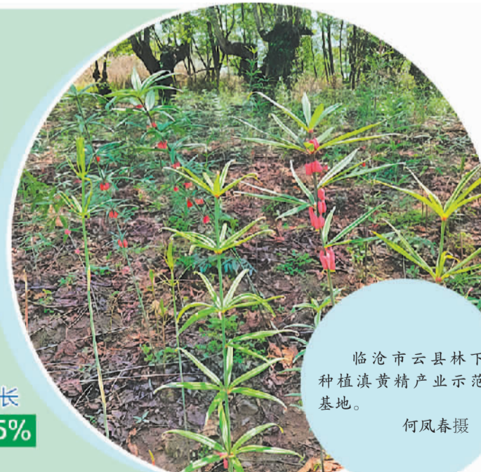
临沧市云县林下种植滇黄精产业示范基地。