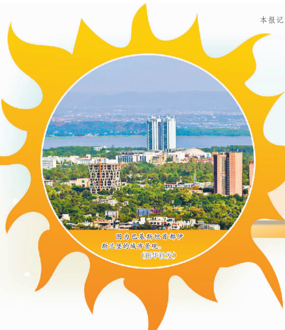
图为巴基斯坦首都伊斯兰堡的城市景观。