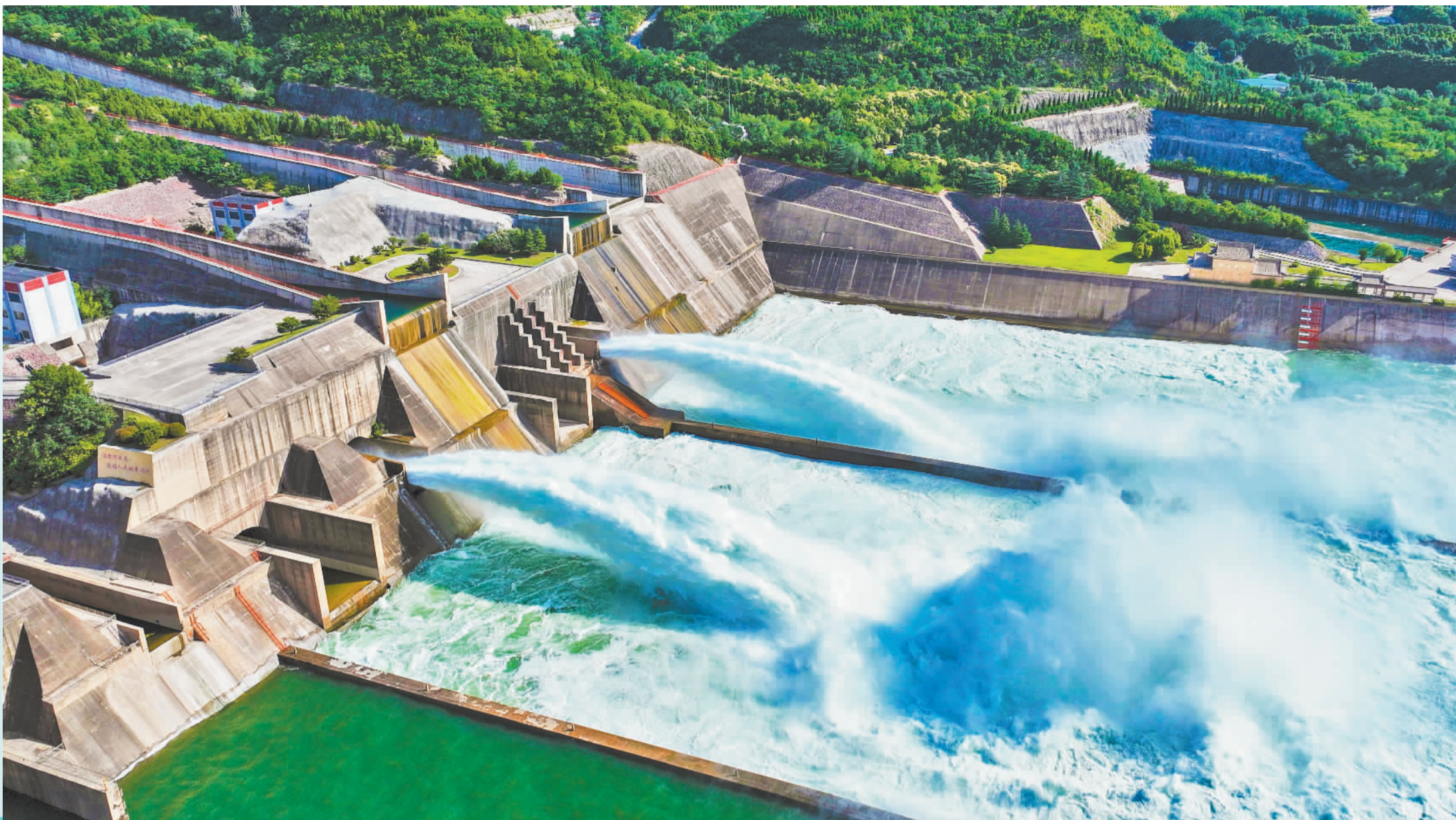
▲6月10日拍摄的黄河小浪底水利枢纽下泄现场。