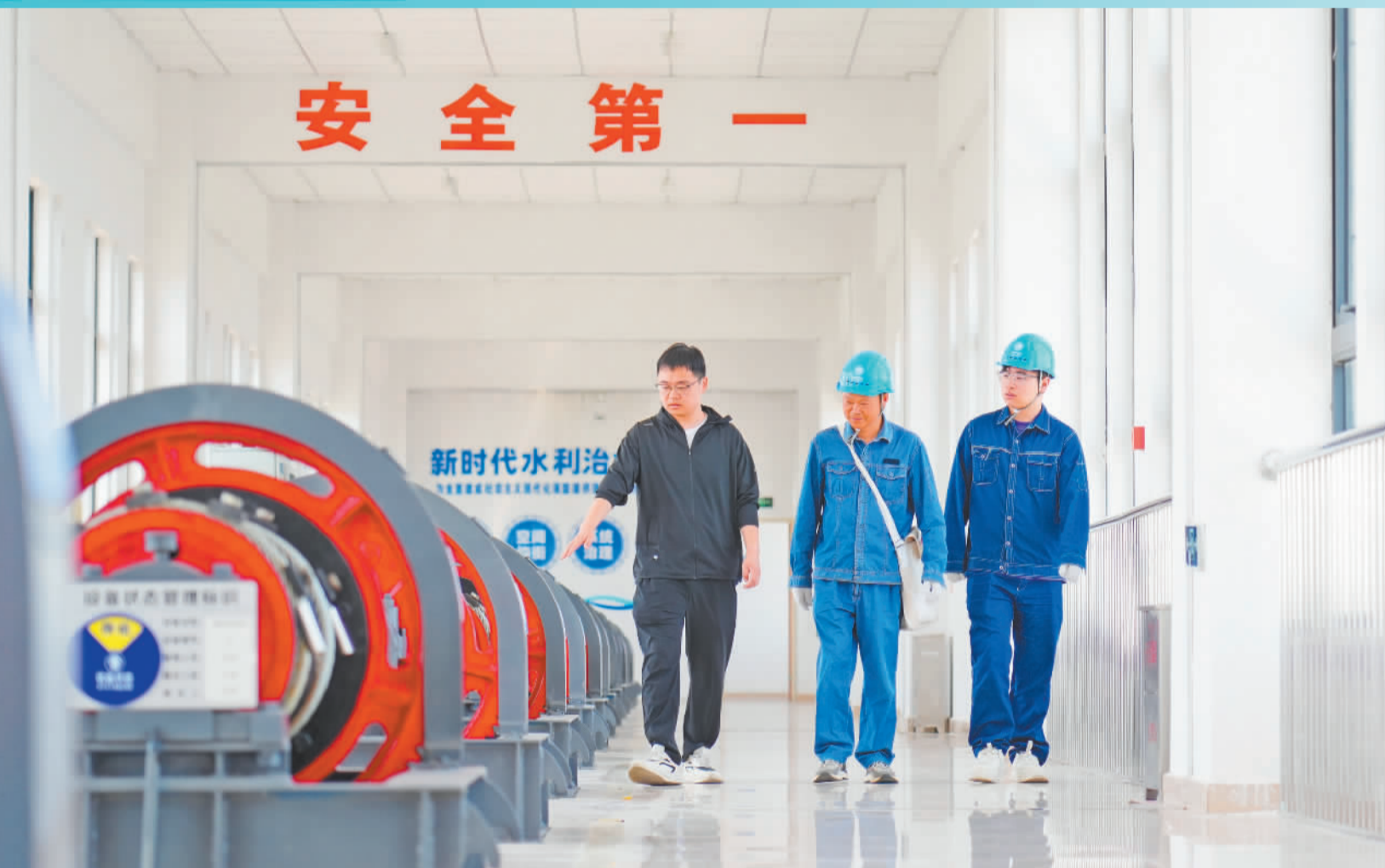
▲6月10日,安徽省滁州市定远县,技术人员对江巷水库排灌站内电力设施进行检修维护,为平稳度汛提供电力保障。